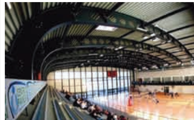
Nella foto sopra: Centro Pavesi Fipav Interno del Palazzetto dello sport