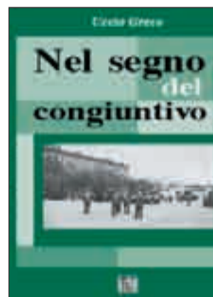
Nel segno del congiuntivo di Uccio Greco 12 euro