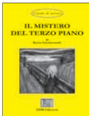
Il mistero del terzo piano di Berto Gambaverde

ALCUNI VOLUMI DELLA COLLANA Gialli di un'ora giunta a 19 libretti che potete richiedere ai rivenditori sotto elencati ciascuno a 3 euro