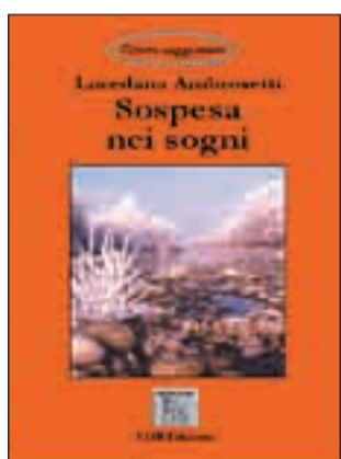
Sospesa nei sogni di Loredana Ambrosetti 5 euro