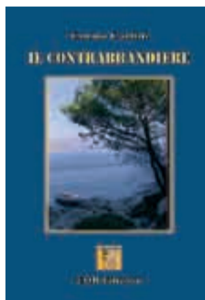
Il contrabbandiere di Enrico Carlini 16 euro