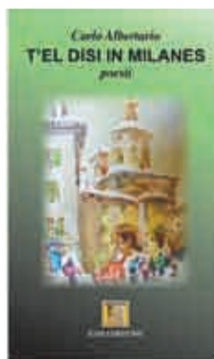
T'el disì in milanès di Carlo Albertario 14 euro