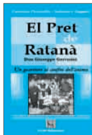
El pret de Ratanà di S. Zappali e C. Picariello 14 euro