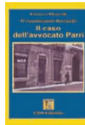
Il caso dell'avvocato Parri di Franco Mercoli 10 euro