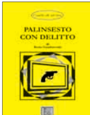
Palinsesto con delitto di Berto Gambaverde