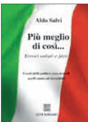
Più meglio di così... di Aldo Salvi 12 euro