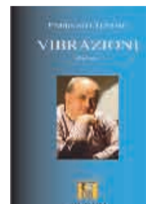
VIBRAZIONI di Francesco Terrone 10 euro