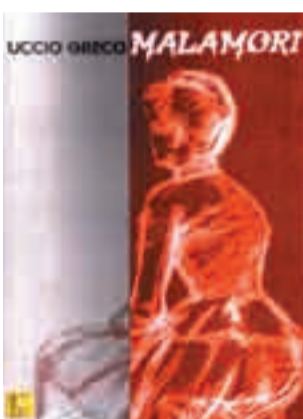
Malamori di Uccio Greco 12 euro