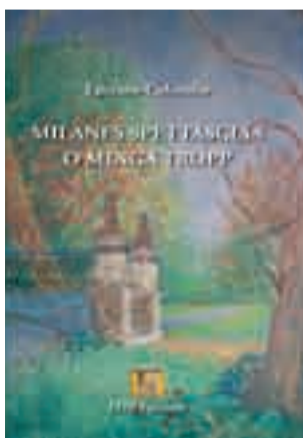
Milanes spettaschiaa di Luciano Colombo 10 euro